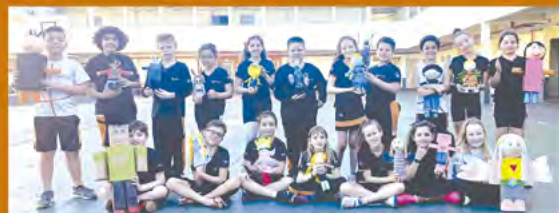
A turma reunida com seus avatares